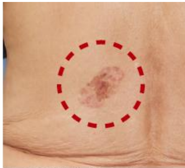
湿疹と間違われやすい 皮膚がんの「ポーエン病」