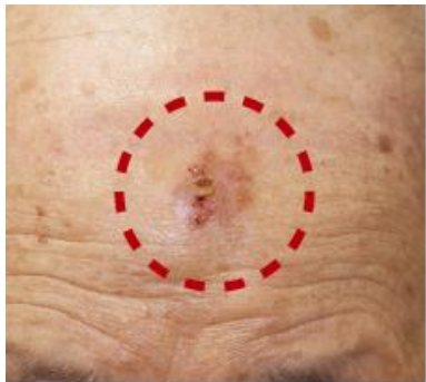
シミと間違われやすい 皮膚がんの「日光角化症」