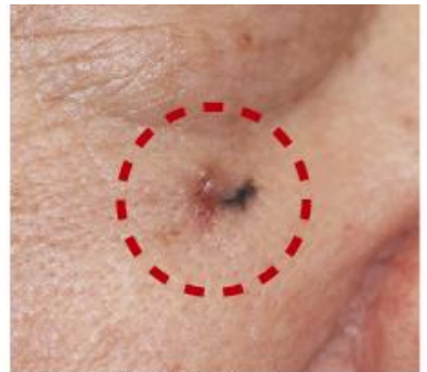
ほくろと間違われやすい 皮膚がんの「基底細胞がん」

もし皮膚がんと診断された場合、手術で病変を取り除く必要があります。当院形成外科では、切除する部分に他の組織などを用いて審美的に再建します。皮膚がんの根治には早期発見が鍵となりますので、少しでも気になる方はお気軽にご相談ください。